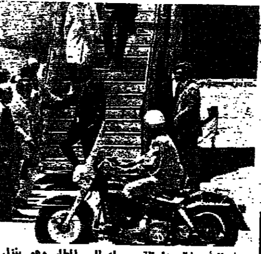
الوزير فانس لحظة وصوله الى المطار وهو ينزل على سلم الطائرة

الاساسيات ... وانضم الى الخلوّة السفير بلركر فانس من الاضواء والوضوح حول بعض النقاط الاساسية . وفي الساعة الواحدة والنقيصة والسابعة والعشرين انضم اليهم الوزير الرئيس الحس وزير الخارجية فؤاد بطرس للتداول في المساعدات الاقتصادية والامنية للبنان وحول سياسة لبنان الخارجية وسط العوامل العربية والدولية وحقيقة موقف لبنان من طلب قوات دولية الى حدوده الجنوبية . وفي الثانية والنقيصة الخامسة والعشرين خرج الرئيس سركيس والوزير الاميركي وهو يحلّ وقفا ابيض اللون لم يكن يجده ساعة فخلوه الى مكتب الرئيس سركيس ومعهما الوفد اللبناني والاميركي واتجه الجميع نحو طاولة الفداء التي غطتها الزهور البيضاء ، واللائحة اللبنانية . وذلك في الطابق الخاص بالرئيس سركيس في الطابق الثاني من القصر . ومن الثانية والنقيصة بعد الظهر وحتى الساعة الرابعة الا عشر ناقش بين الوزير فانس والوزير بطرس في الطابق الثاني من القصر . وعلم ان جولة ثالثة من المباحثات دارت بين الوفدين اللبناني والاميركي حول ازمة الشرق الاوسط والتحصين حول ازمة الشرق الاوسط والتحصين مع الاتحاد السوفياتي ، ومقعد تسييل للفلسطينيين واللائحة الاميركية . اللبنانية والمساعدات الاميركية الى لبنان .